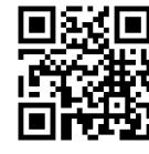
交通アクセス (ホームページ)