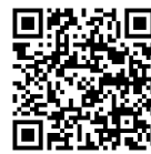
キャンパスマップ (ホームページ)