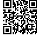
ノートパソコン 必携化 (ホームページ)