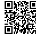
ノートパソコン 必携化 (ホームページ)