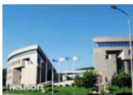
中国の瀋陽市に位置する東軟集団 Neusoft which is located in Shenyang, China

Based on the idea that consumption behavior differs depending on divergent country and social religiosity, cross cultural surveys are conducted to figure out how divergent cultures influence consumer cognition, decision, and behavior differently.