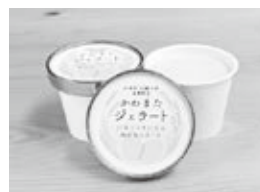
◁かわまたジェラート

事業の実施期間は令和3～7年度の5か年の予定です。初年度の令和3年度は、町関係者との検討会の開催や「かわまたジェラート 川俣シャモになる卵のカスタード」の商品化、SDGs 探究授業用のデジタル教材の作成、川俣町民向けのアンケート調査などが行われました。